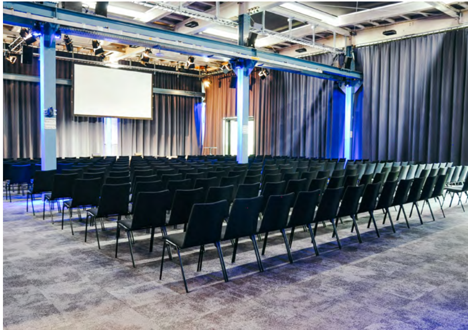
Raum C, OG - 240 Personen (120m 2 )